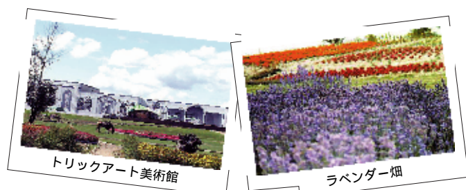
トリックアート美術館

では、富良野近辺においての際には、冒頭にもご紹介させて頂きました弊社関連各観光施設を是非ご利用願いますとともに、末筆ながら、MC様の今後の益々のご繁栄・ご活躍を御祈念申し上げます。