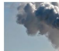
CO 2 (post-industrial)