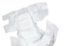
Diapers (filling material)