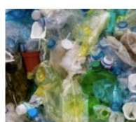
Mixed Plastic Waste