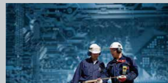
ISO 45001 労働安全衛生マネジメントシステム