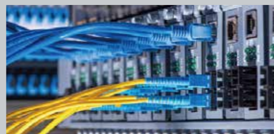
ISO 27001 情報セキュリティマネジメントシステム