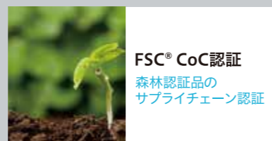
FSC® CoC認証 森林認証品の サプライチェーン認証