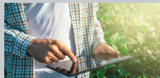
ISO 22000 食品安全マネジメントシステム