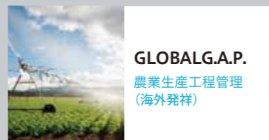
GLOBALG.A.P. 農業生産工程管理 (海外発祥)