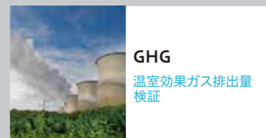
GHG 温室効果ガス排出量 検証