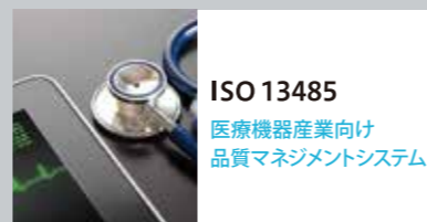
ISO 13485 医療機器産業向け 品質マネジメントシステム