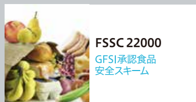
FSSC 22000 GFSI承認食品 安全スキーム