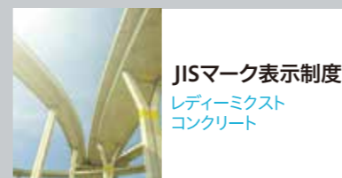
JISマーク表示制度 レディーミクスト コンクリート