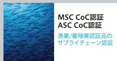
MSC CoC認証 ASC CoC認証 漁業/養殖業認証品の サプライチェーン認証