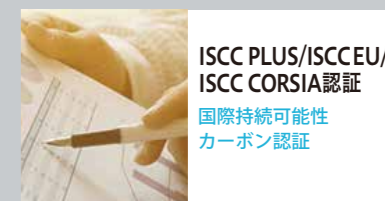
ISCC PLUS/ISCC EU/ ISCC CORSIA認証 国際持続可能性 カーボン認証