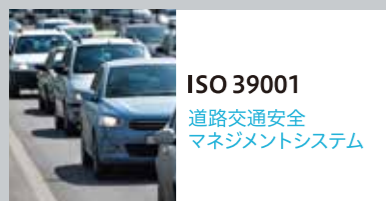
ISO 39001 道路交通安全 マネジメントシステム