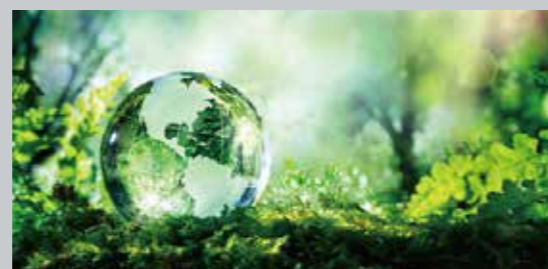
ISO 14001 環境マネジメントシステム