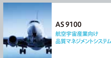
AS 9100 航空宇宙産業向け 品質マネジメントシステム