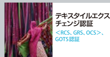
テキスタイルエクス チェンジ認証 <RCS、GRS、OCS>、 GOTS認証