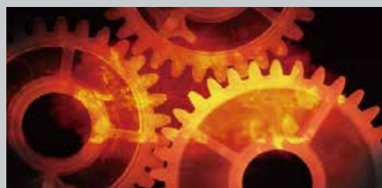
ISO 9001 品質マネジメントシステム

インターテック・サーティフィケーションは、UKAS(英国)等のインターテック・グループが取得したすべての認定に基づき、日本国内で幅広い認証活動を行っています。お客様は巨大な多国籍企業から小規模組織まで30,000社を超え、みなさまの理想的なビジネスパートナーとして、未来に変革と付加価値をもたらすような効果のある認証サービスを提供しています。