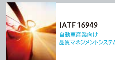
IATF 16949 自動車産業向け 品質マネジメントシステム