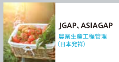
JGAP, ASIAGAP 農業生産工程管理 (日本発祥)