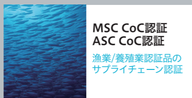
MSC CoC認証 ASC CoC認証 漁業/養殖業認証品の サプライチェーン認証