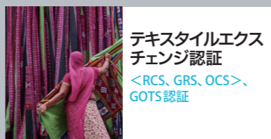
テキスタイルエク スチェンジ認証 <RCS、GRS、OCS>、 GOTS認証