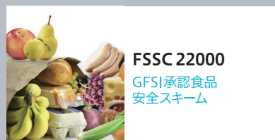
FSSC 22000 GFSI承認食品 安全スキーム