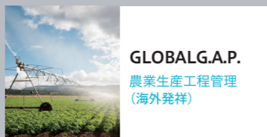
GLOBALG.A.P. 農業生産工程管理 (海外発祥)