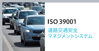
ISO 39001 道路交通安全 マネジメントシステム