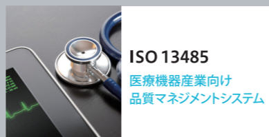
ISO 13485 医療機器産業向け 品質マネジメントシステム