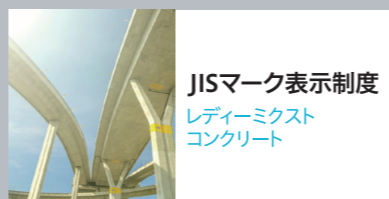
JISマーク表示制度 レディーミクス コンクリート