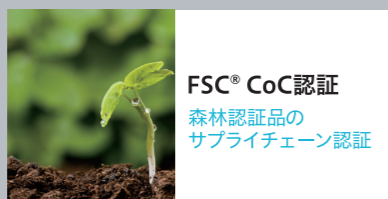
FSC® CoC認証 森林認証品の サプライチェーン認証