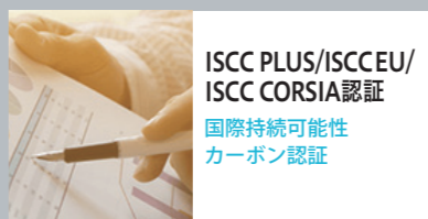
ISCC PLUS/ISCC EU/ ISCC CORSIA認証 国際持続可能性 カーボン認証