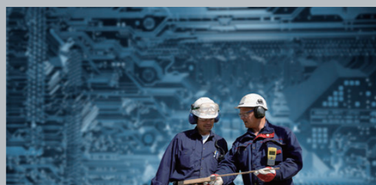
ISO 45001 労働安全衛生マネジメントシステム