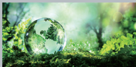
ISO 14001 環境マネジメントシステム