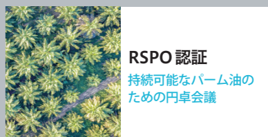
RSPO 認証 持続可能なパーム油の ための円卓会議