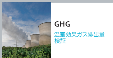
GHG 温室効果ガス排出量 検証