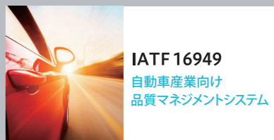
IATF 16949 自動車産業向け 品質マネジメントシステム