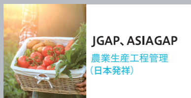
JGAP, ASIAGAP 農業生産工程管理 (日本発祥)