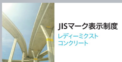
JISマーク表示制度 レディーミクス コンクリート