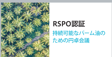
RSPO認証 持続可能なパーム油の ための円卓会議