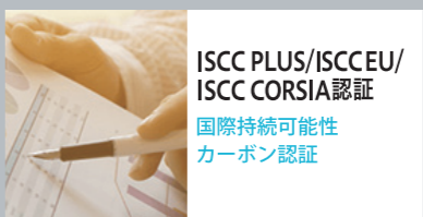
ISCC PLUS/ISCC EU/ ISCC CORSIA認証 国際持続可能性 カーボン認証