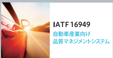
IATF 16949 自動車産業向け 品質マネジメントシステム