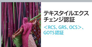
テキスタイルエク ステンジ認証 <RCS、GRS、OCS>、 GOTS認証