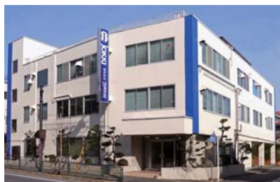
本社 (東京都練馬区)

株式会社ジョッキは、イカを中心としたおつまみを製造・販売している食品メーカーです。原料と製造工程にこだわりを持ち、高品質で美味しい商品を提供し続けております。多様化するお客様のニーズにお応えするため、新たな加工技術の構築をはじめ、あらゆる食のシーンを演出できるように、新しいジャンルの商品づくりにもチャレンジしています。