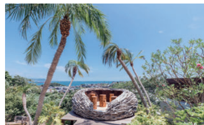
施工実績：店舗カフェー鳥の巣テラス

らとれるエッセンシャルオイル事業にも取り組み、植物管理のノウハウを応用した高品質な製品づくりを推進。造園事業との相乗効果により、地域資源の価値向上と新たな魅力創出を図り、持続可能な地域社会の実現に貢献しています。