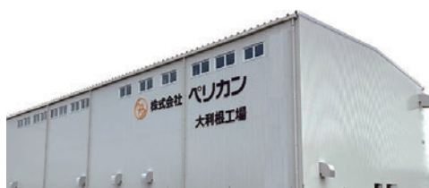
大利根工場 (埼玉県加須市)

当社では1985年に埼玉県で創業し、豆類・雑穀を中心とした原料の選別・加工を受託にて行っております。大豆では、脱皮加工、ひきわり加工、粉碎加工に加え、近年はより高度な技術を要する組織状大豆ミートの製造など、多様な加工ニーズに対応してきました。雑穀・加工澱粉・米粉・香辛料など幅広い原料に対応し、課題を迅速に解決する「業界のお助けマン」として信頼を得ています。