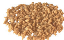
粉碎加工例：大豆ミート製品「Soyφ (ソイファイ) ミート」

現在は抹茶粉碎など新規分野での引き合いも増えており、これらの取り組みが新たな取引先様にも安心を提供する基盤となっています。他社が手掛けない分野に挑戦し独自技術を培ってきた当社は、その強みを活かして新たなニーズに応え、社会の変化に対応しながら事業拡大を進める一方、今後は新工場の立ち上げと自社製品の製造・販売を進め、国内外へ価値を提供できる企業を目指します。